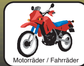
Motorräder / Fahrräder