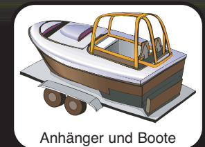
Anhänger und Boote