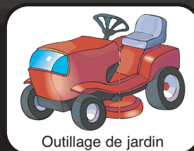
Outils de jardin