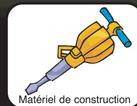
Matériel de construction