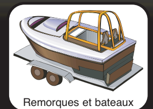
Remorques et bateaux

Marques et brevets internationaux en instance