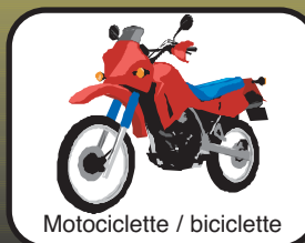
Motociclette / biciclette