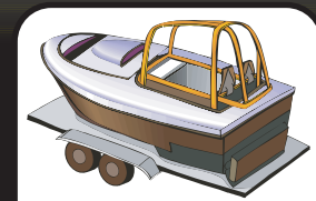
Rimorchi e imbarcazioni

Brevetti e marchi in corso di concessione in tutto il mondo